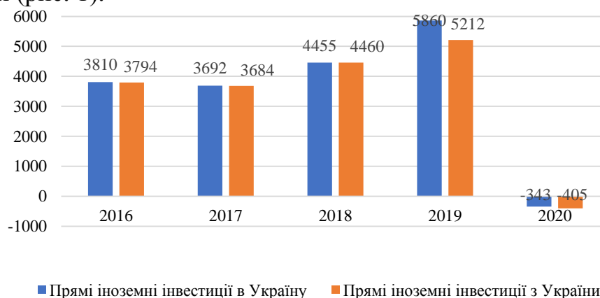
Рис. 1 – Прямі іноземні інвестиції в Україну з 2016-2020 рр, млн. дол. США

Розглянемо динаміку обсягів прямих іноземних інвестицій в Україні за 2016-2020 роки (рис. 1).